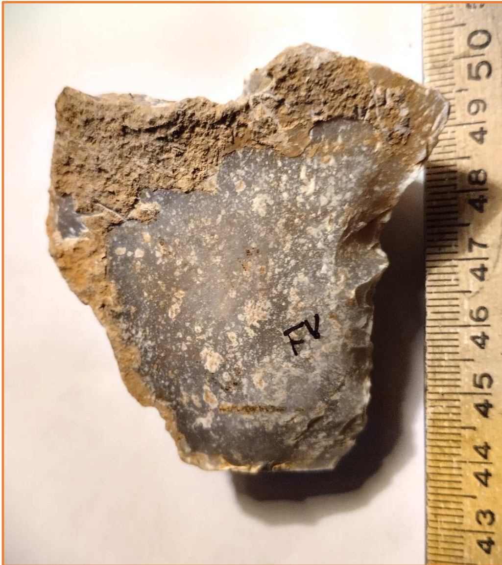
RASCADORA DENTICULADA. D 24