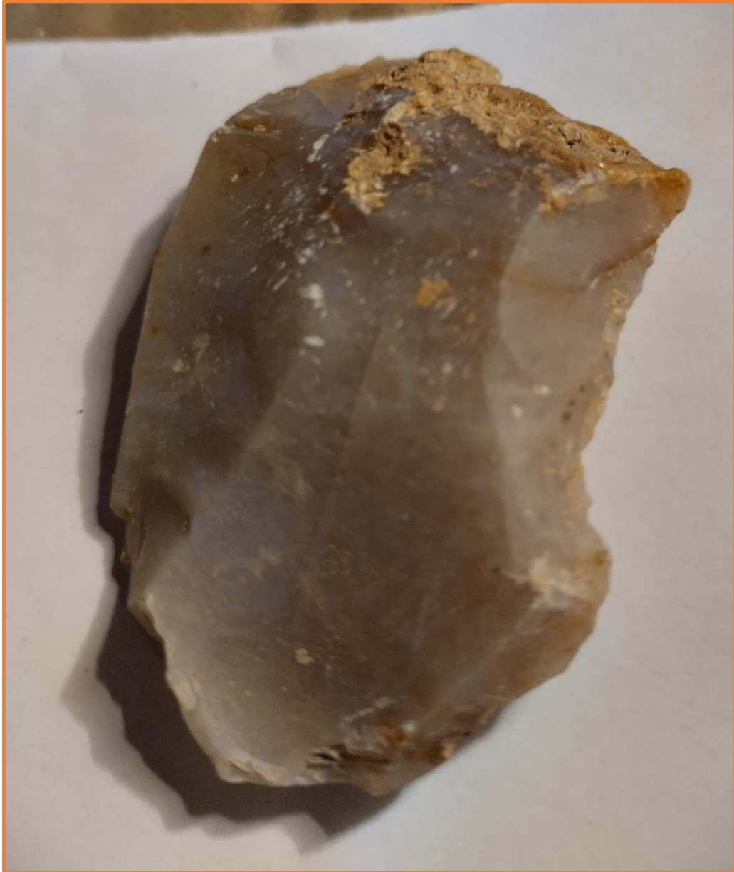
RASCADORA CÒNCAVA (S p d med dist dreta )- (D21 )